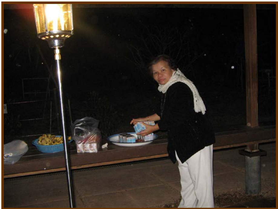
นี่ก็เตรียมของใส่บาตรจ้า