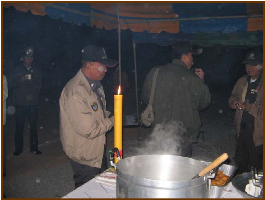
อากาศหนาวๆ เช่นนี้ เจ้าหน้าที่ตำรวจได้รับน้ำเต้าหู้ ปาต่องโก๋รองท้องก่อน ก็ ปฏิบัติหน้าที่อำนวยความสะดวก ผู้มาร่วมบุญได้อย่างเต็มที่