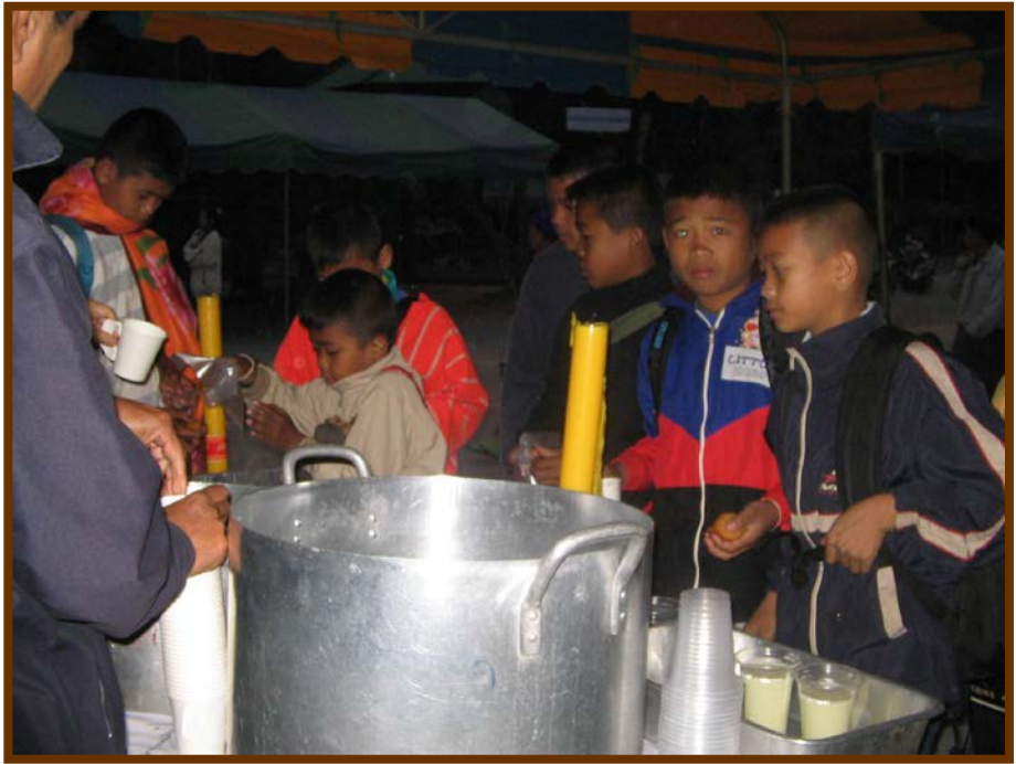
เด็กๆน่ารักมาร่วมทำบุญและขอรับน้ำเต้าหู้ ปาท่องโก๋ ด้วยนะครับ