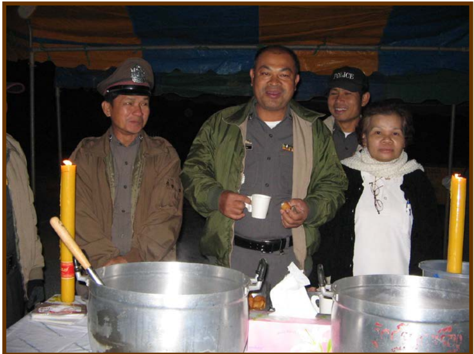
มีกาแฟ โอวัลติน น้ำเต้าหู้ไว้แจกด้วยนะคะ ท่านรองผู้กำกับไซพิสัยมาใช้บริการก่อนเพียบ