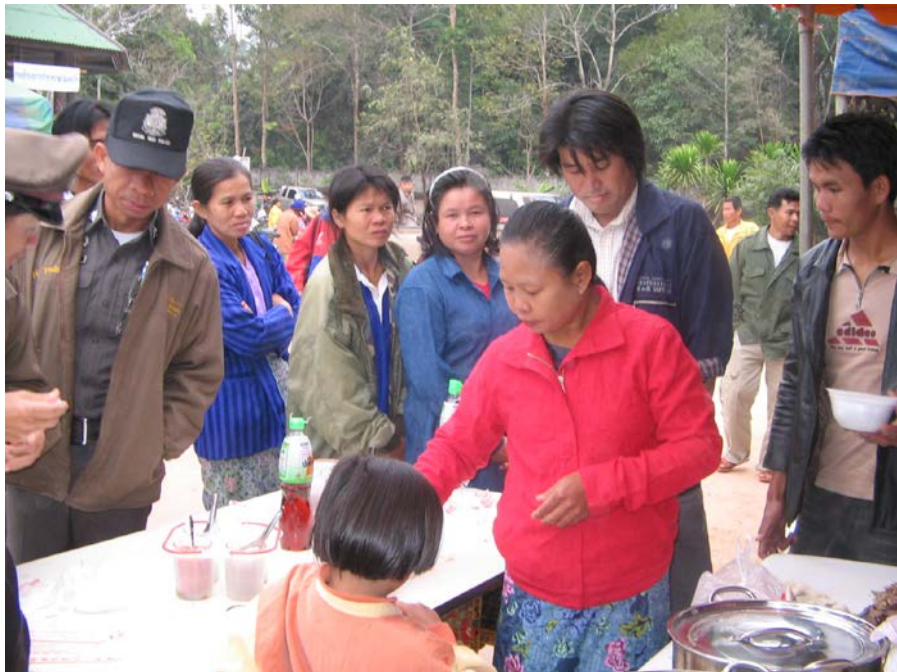
ผู้มาร่วมทำบุญเข้าแถวรับก๋วยเตี๋ยวเป็ดจ้า