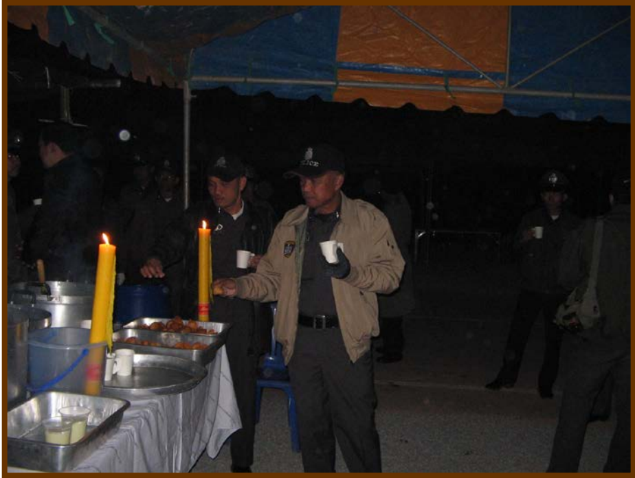
ดีใจที่คุณตำรวจมารับน้ำเต้าหู้-ปาต่องโก๋ ตั้งแต่ตี 4 ยังไม่สว่างเลย