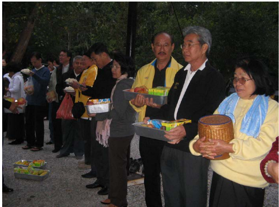
ทั้งเจ้าหน้าที่และชาวบ้านเตรียมพระคุณเจ้ามารับบิณฑบาต