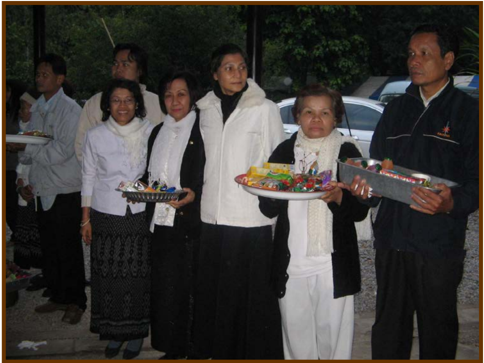
ทุกๆ คนเตรียมรอใส่บาตรพระคุณเจ้า