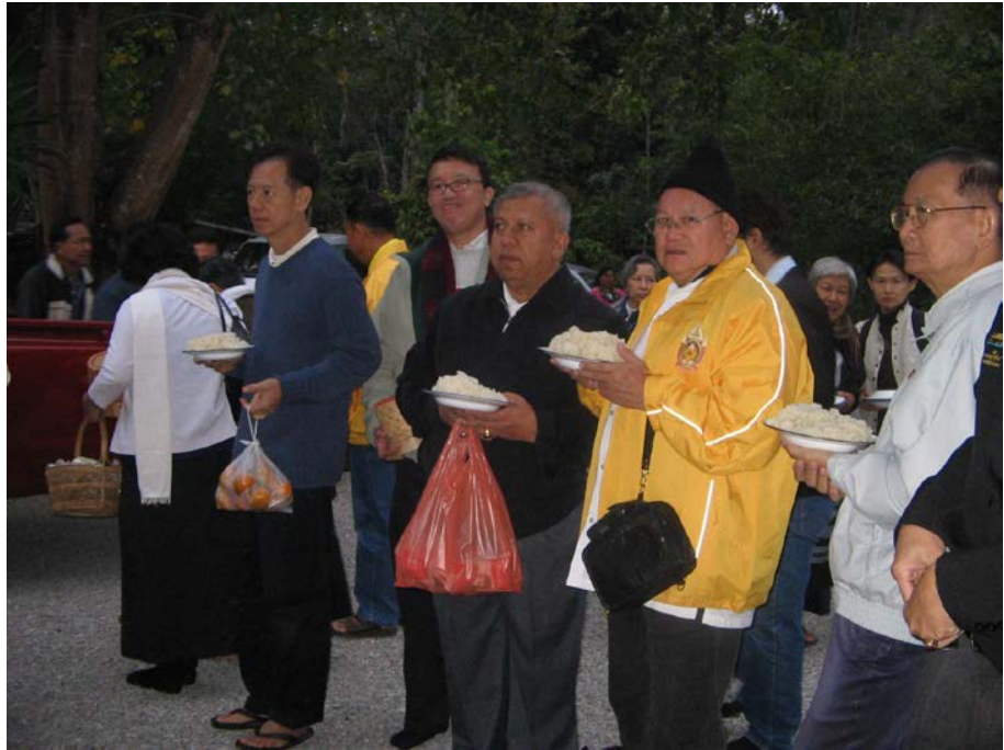
ญาติโยมพุทธศาสนิกชนเข้าแถวเตรียมรอใส่บาตร