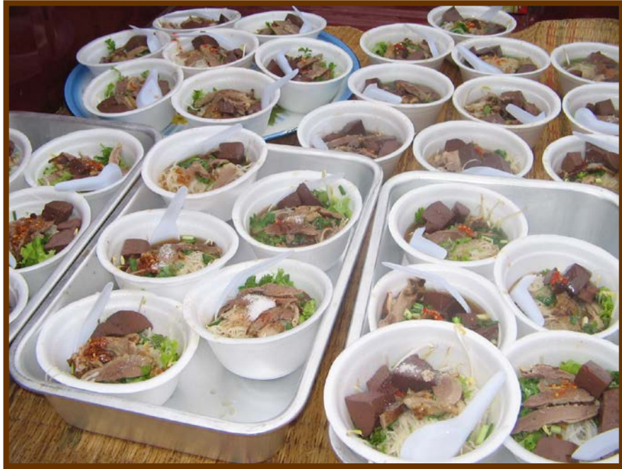
“ไก่ยิวเป็ด” สำหรับถวายพระสงฆ์ 35 รูป