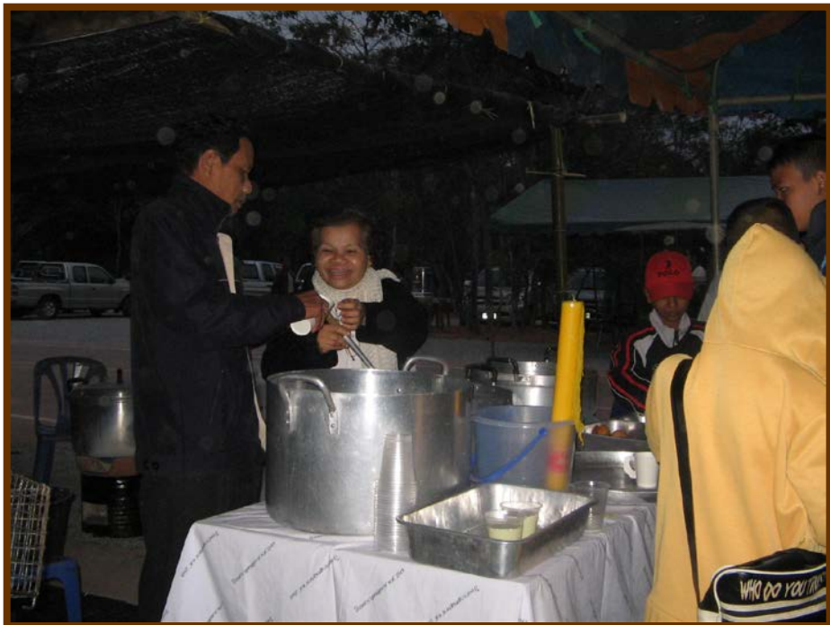
คุณป้าช่วยตักน้ำเต้าหู้ บริการปาฟองโก้อย่างเต็มที่