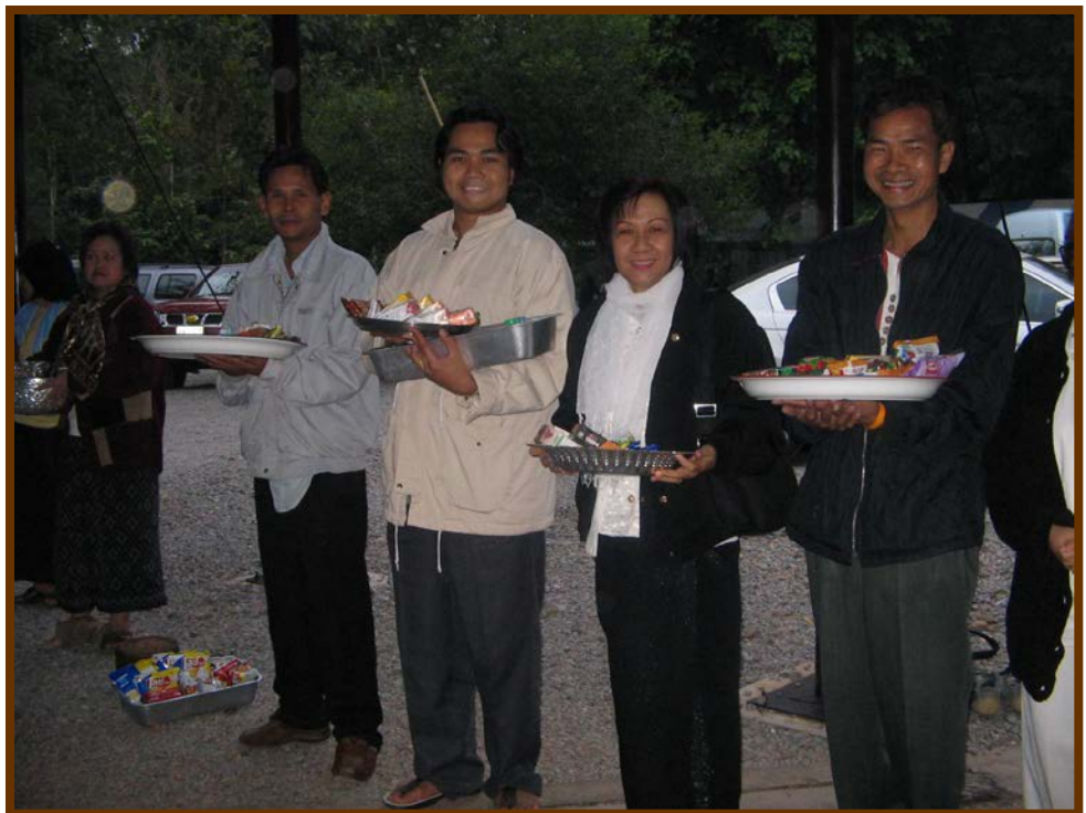
ยิ้มแย้ม พร้อมรับบุญถวายภัตตาหารใส่บาตร