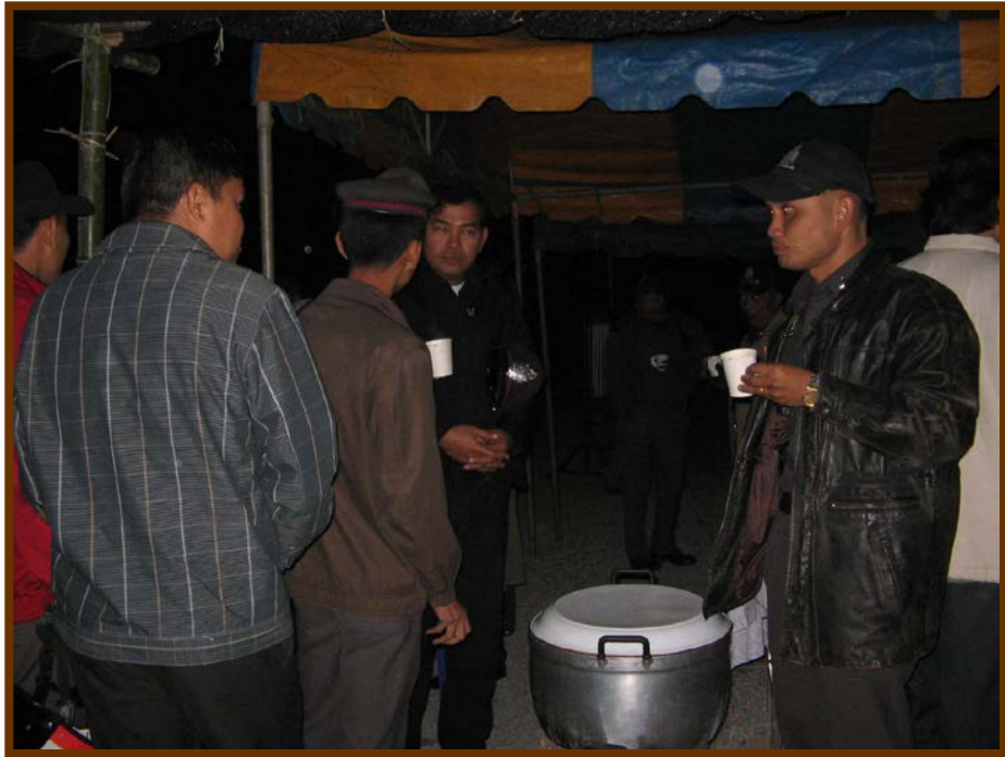
เต็มทีเลยนะค่ะ คุณตำรวจและทหารด้วย มาร่วมทำบุญและปฏิบัติหน้าที่พร้อม