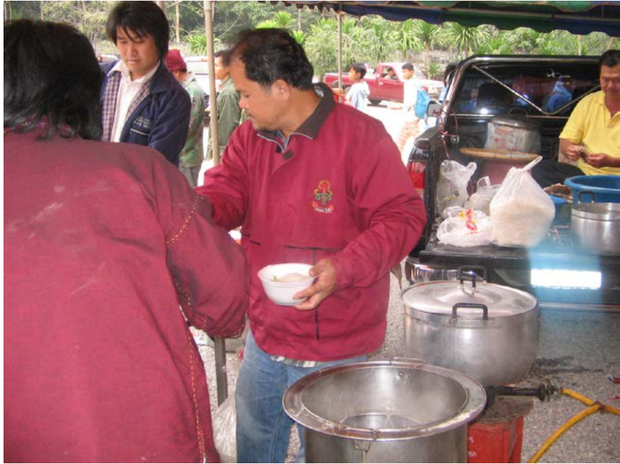
เจ้าของโรงงานก๋วยเตี๋ยวเป็ด มาให้บริการด้วยตนเองเลยนะคะ