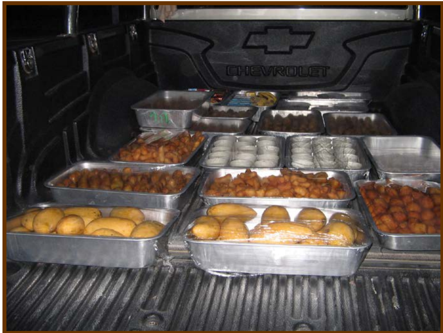
ภัตตราหารที่บรรจงเตรียมพร้อมถวายในการทำบุญเช้านี้