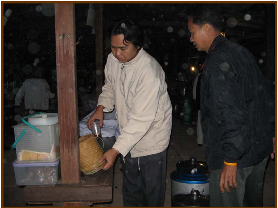
คนละไม้ คนละมือพร้อมทำบุญ