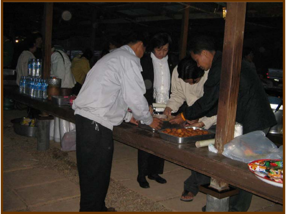
ช่วยกันจัดอาหารพร้อมถวาย