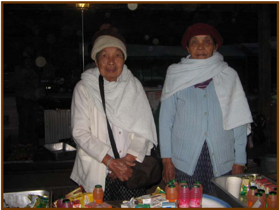
คุณยายผู้ใจบุญเตรียมรอใส่บาตร