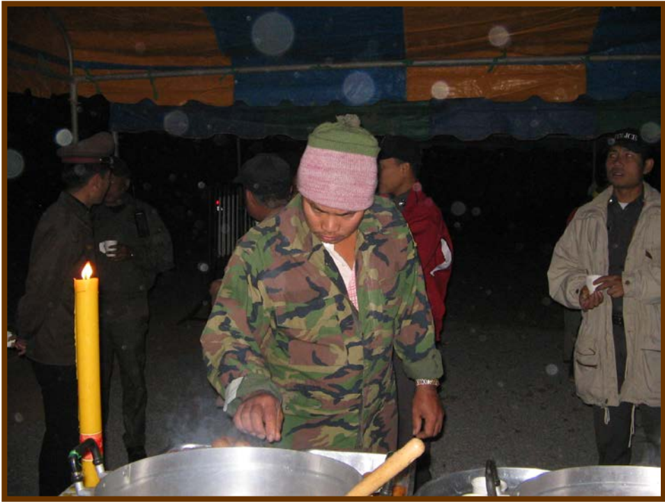
ทั้ง อส. และตำรวจมารับบริการก่อนเพื่อน