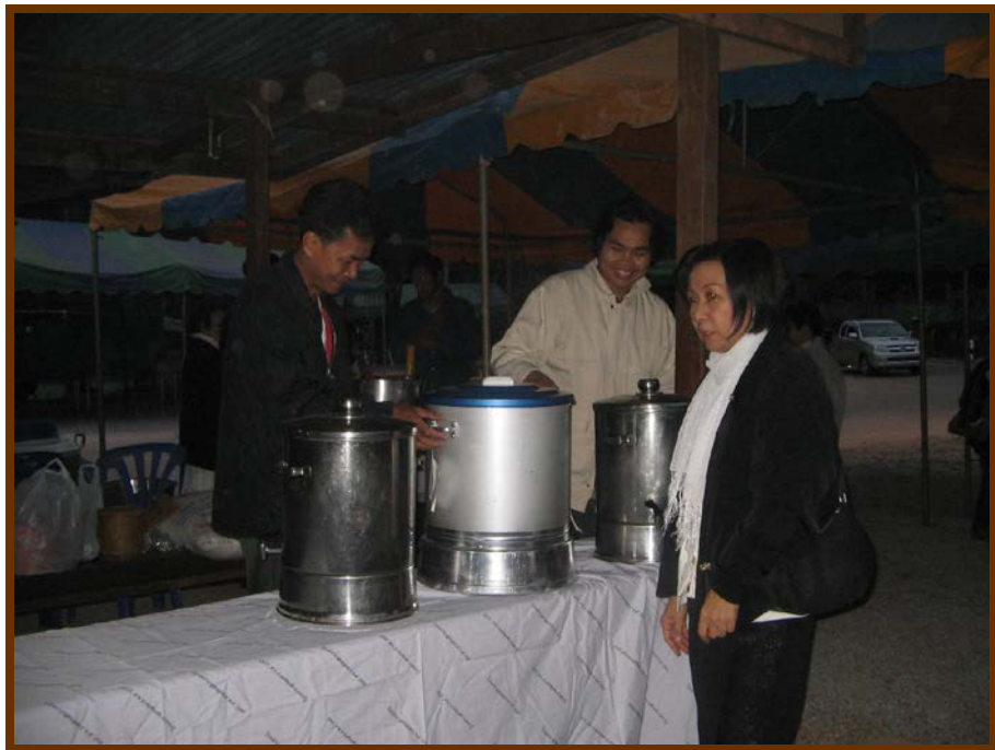
ต้มเสร็จแล้วก็นำมาใส่ภาชนะพร้อมแจกผู้มาร่วมทำบุญตั้งแต่เวลา 04.00น.