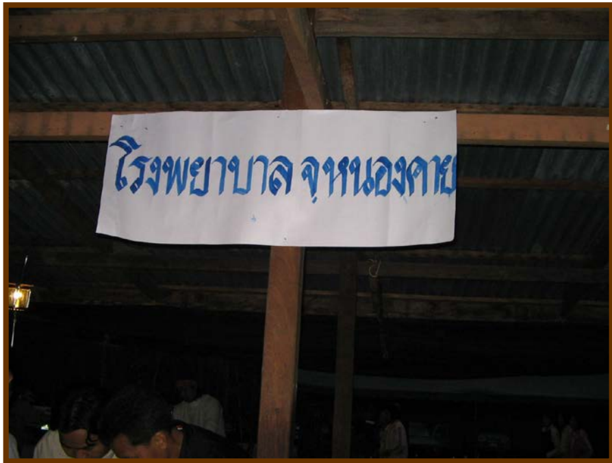
โรงทานอาหารและน้ำปानะโรงพยาบาลหนองคาย