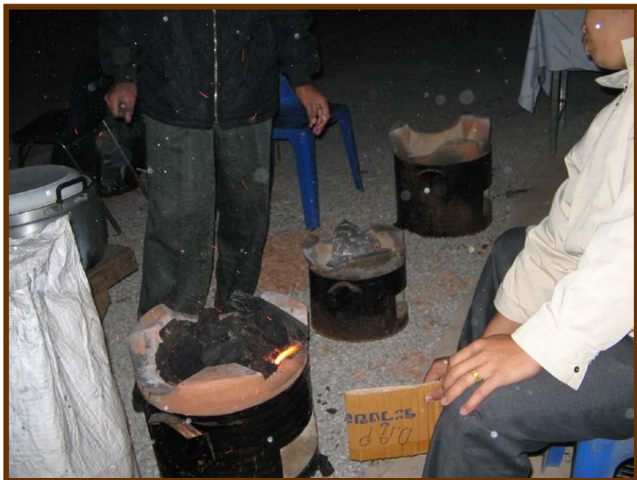
เบื้องหลังโรงทานน้ำปานะกำลังเตรียมความพร้อมต้มน้ำสมุนไพรจะ