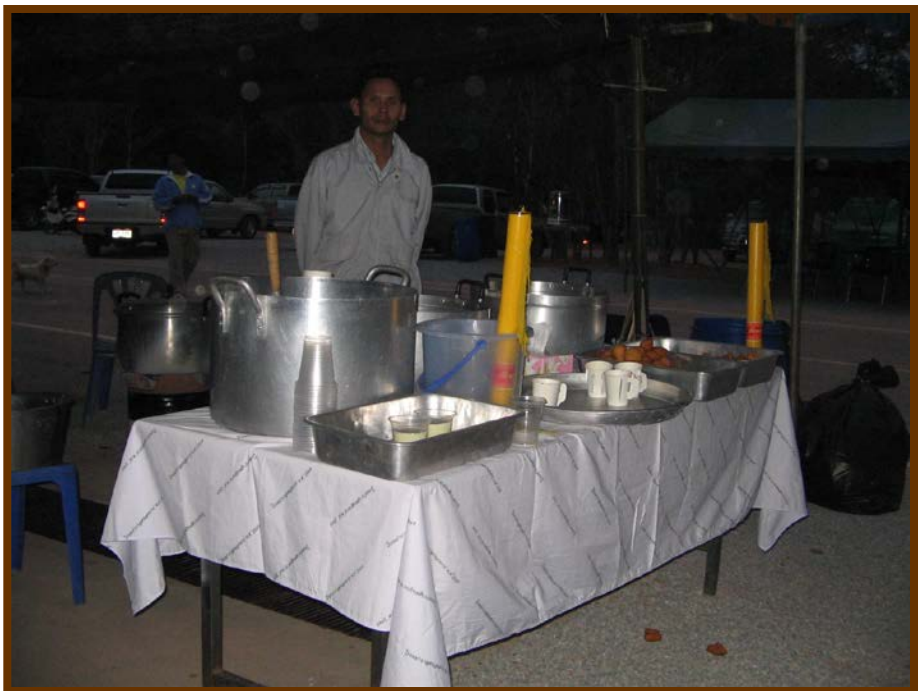
พร้อมสำหรับนักแสวงบุญนะครับ โรงทานโรงพยาบาลหนองคาย