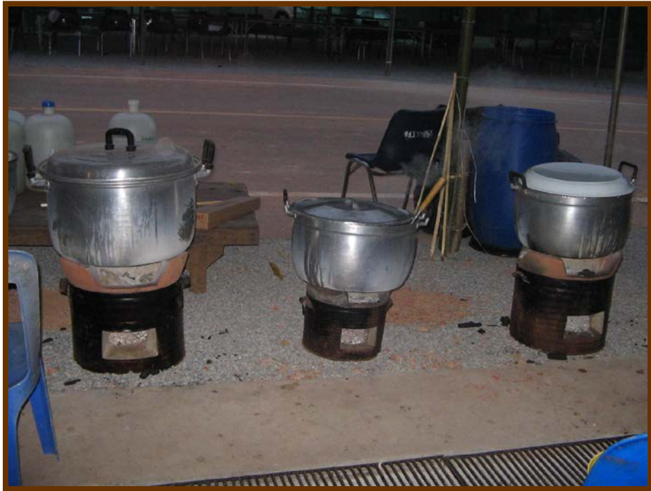
มีทั้งน้ำมะตูม น้ำกระเจี๊ยบ นำลำไยนะคะ